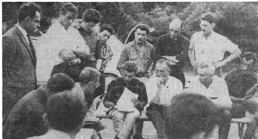
Un tour de force réalisé grâce à l'effort commun de nombreuses bonnes volontés

Il était 23 h. et la longue attente commençait, déprimante, irritante pour ceux de la surface qui ne pouvaient suivre le chemi-