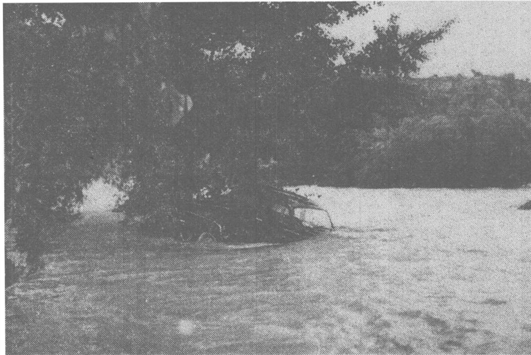
Une voiture de campeur, entraînée par les eaux, a été retenue par un arbre sur les rives de la Beaume.